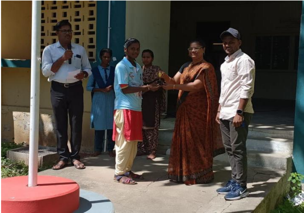
Students got prizes in Marathon competition