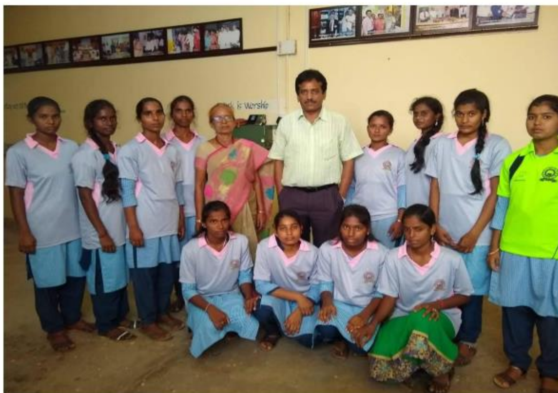
Women students got prizes in various sports and Games